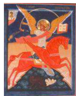
Tavola in cm. est.30x38 int.24x32 oppure est. 35x44 int.30x38

Le dimensioni possono essere anche diverse purchè venga mantenuto il rapporto fra le dimensioni interne della culla