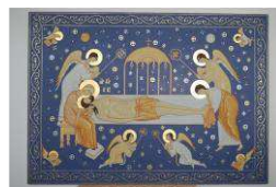
Tavola senza culla in cm. 55x40 oppure 60x45